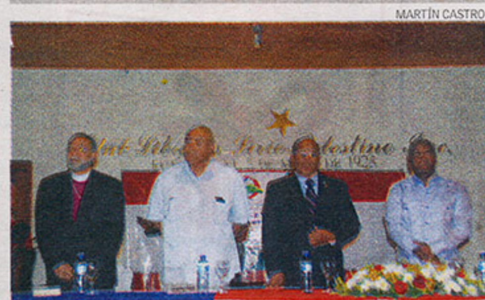
Entre objetivos del encuentro está analizar la sentencia del TC.

Expuso que algunos sectores han mal interpretado esta coyuntura para crear debates, e inconscientemente hacer daño a la imagen del país. Es bueno que se sepa que República Dominicana no es signataria de la CIDH, ya que no se ha presentado al Congreso.