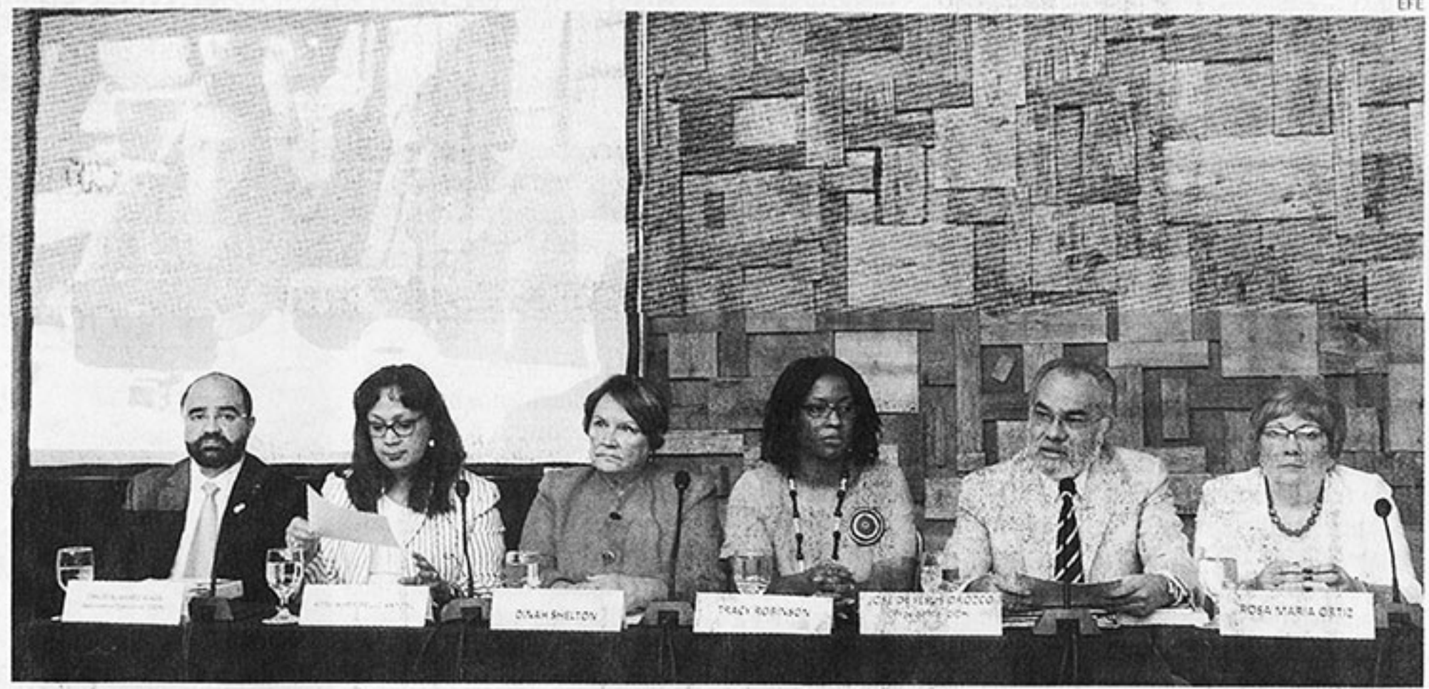
Los casos. La misión de la CIDH dijo ayer en rueda de prensa que analizó 3,994 personas desde el lunes cuando llegó al país, escuchando las denuncias y testimonios sobre la alegada desnacionalización de descendientes de haitianos y violaciones a los derechos humanos.