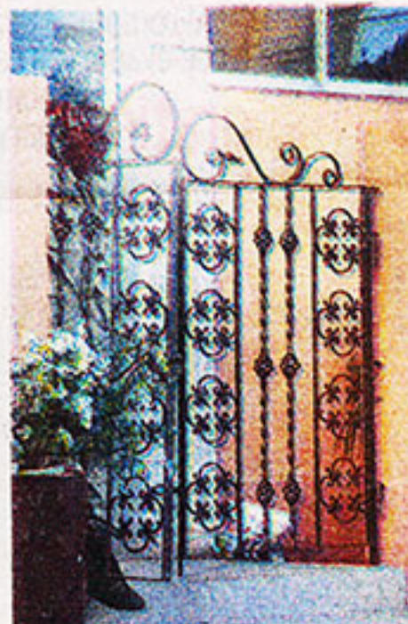
Puerta fue reinstalada.

Llamaba la atención de la delegación de la Comisión Interamericana de Derechos Humanos (CIDH), que se encontraba de visita hasta ayer en el país, para que atendiera su caso.