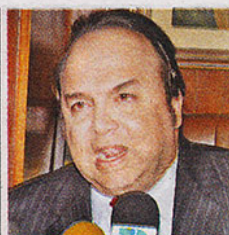
CALIFICA INFORME COMO ADEFESIO