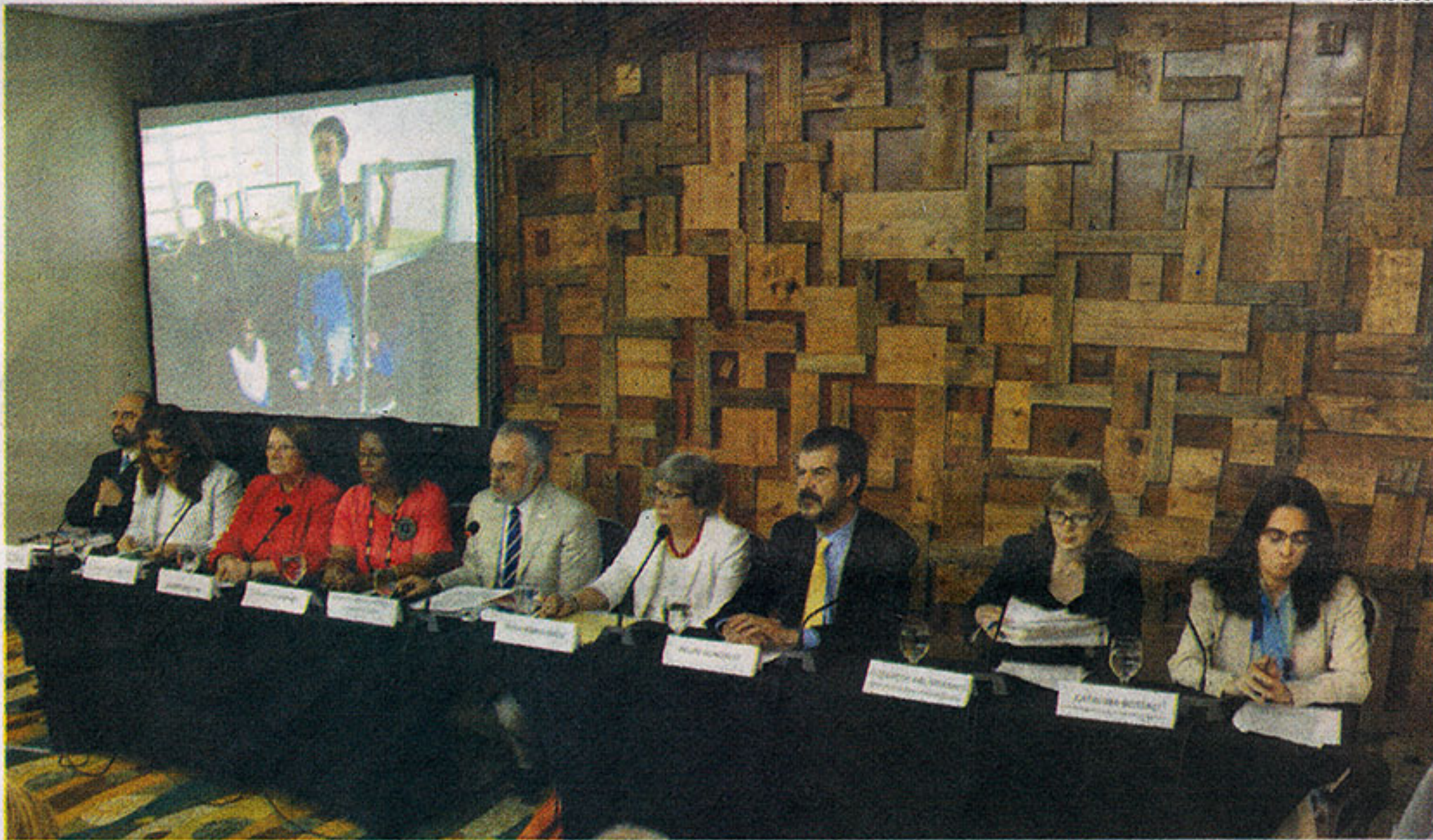
Vista de la rueda de prensa de los comisionados de la CIDH que visitaron al país para evaluar los efectos de la sentencia del Constitucional.

que durante la visita recibió información preocupante sobre graves vulneraciones al derecho a la nacionalidad, a la identidad, a la igualdad ante la ley, y a la no discriminación.