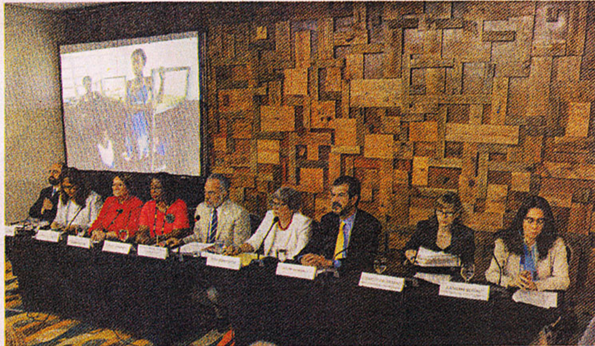
Vista de la rueda de prensa de los comisionados de la CIDH que visitaron al país para evaluar los efectos de la sentencia del Constitucional.

que durante la visita recibió información preocupante sobre graves vulneraciones al derecho a la nacionalidad, a la identidad, a la igualdad ante la ley, y a la no discriminación.