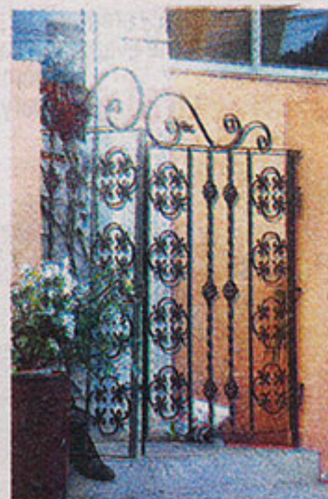
Puerta fue reinstalada.

Llamaba la atención de la delegación de la Comisión Interamericana de Derechos Humanos (CIDH), que se encontraba de visita hasta ayer en el país, para que atendiera su caso.