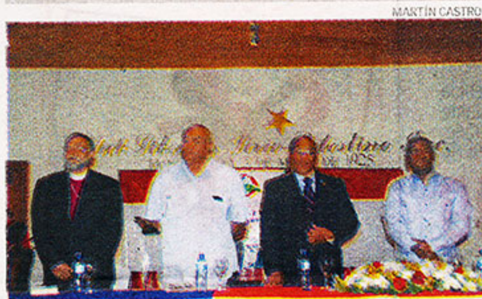
Entre objetivos del encuentro está analizar la sentencia del TC.

El ciudadano haitiano fue trasladado al Centro Médico UCE, donde se informó a DL que fue despachado luego de ser atendido en el área de emergencias.