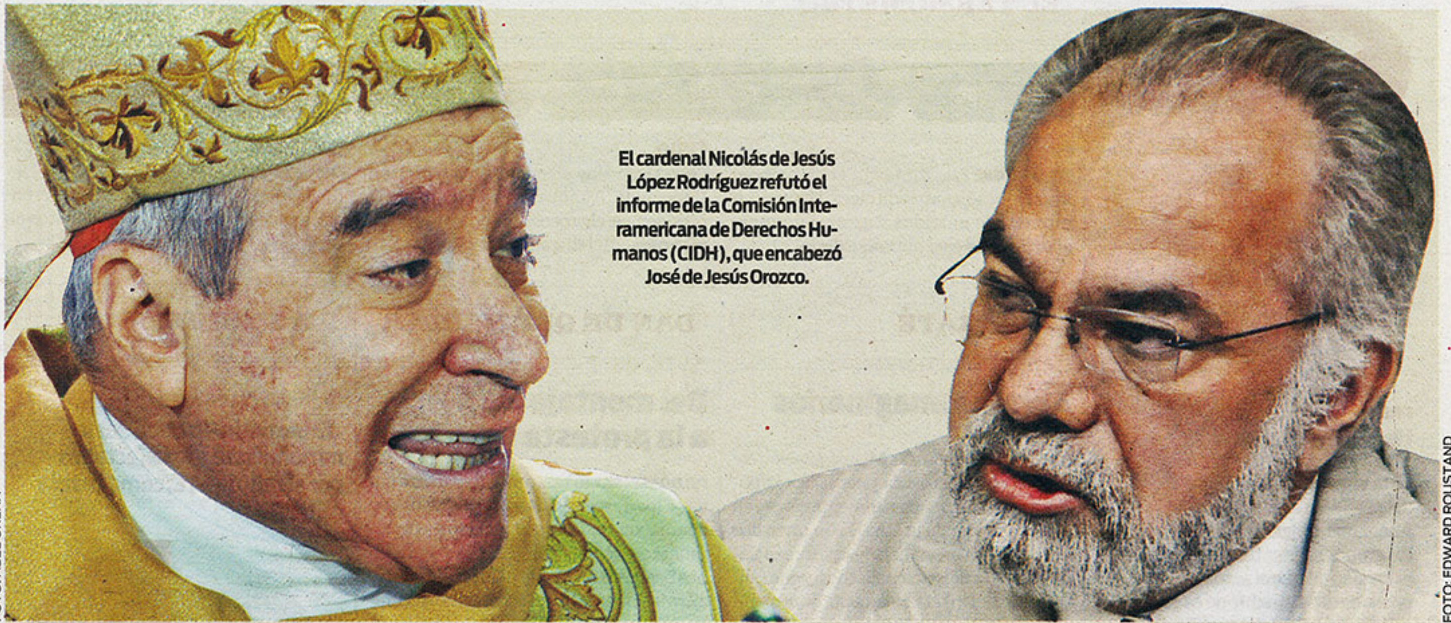
El cardenal Nicolás de Jesús López Rodríguez refutó el informe de la Comisión Interamericana de Derechos Humanos (CIDH), que encabezó José de Jesús Orozco.