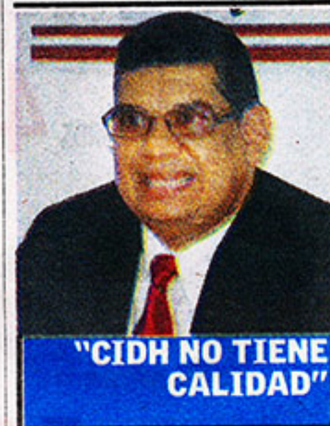
"CIDH NO TIENE CALIDAD"