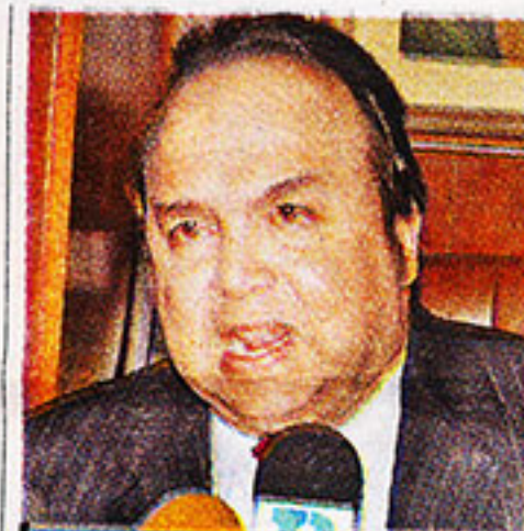
CALIFICA INFORME COMO